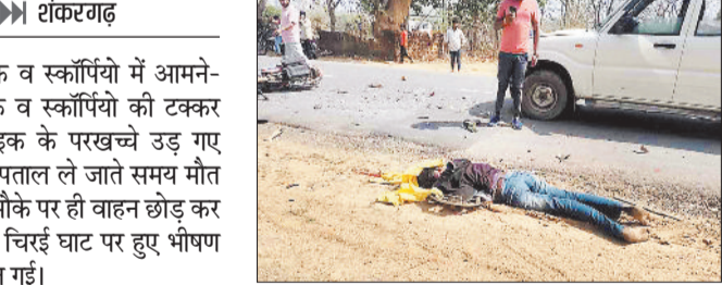
बाइक सवार सड़क किनारे जा गिरा जिससे गंभीर रूप से घायल हो गया। इधर घटना के बाद स्कॉर्पियो सवार मौके पर ही वाहन को छोड़ फरार हो गए। घटना को देख राहगीरों ने तत्काल एंबुलेंस से घायल को सामुदायिक स्वास्थ्य केन्द्र शंकरगढ़ पहुंचाया जहां चिकित्सकों ने जांच उपरांत युवक को मृत घोषित कर दिया। सूचना पर पुलिस ने मौके पर पहुंच घटना कारित वाहनों को जब्त कर स्कॉर्पियो सवार की तलाश शुरू कर दी है।

क्षेत्र के चिरई घाट पर बाइक व स्कॉर्पियो में आमने-सामने टक्कर हो गई। बाइक व स्कॉर्पियो की टक्कर इतनी जबरदस्त थी कि बाइक के परखच्चे उड़ गए जबकि बाइक सवार की अस्पताल ले जाते समय मौत हो गई। इधर पिकअप सवार मौके पर ही वाहन छोड़ कर फरार हो गए। मंगलवार को चिरई घाट पर हुए भीषण हादसे से क्षेत्र में सनसनी फैल गई।