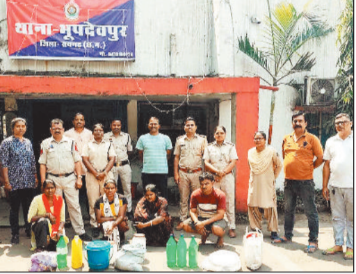
कलेक्टर ने अधोसंरचना विकास से जुड़े आवेदनों, विशेषकर सड़क निर्माण एवं अन्य मूलभूत सुविधाओं के प्रस्तावों पर गंभीरता से कार्य करने के निर्देश दिए।

पुलिस और आबकारी विभाग की संयुक्त टीम ने भूपदेवपुर व थाना क्षेत्र के बिलासपुर, किरीतमाल में 92 लीटर महुआ शराब और लगभग 200 किलो लाहन बरामद किया गया। सहायक आयुक्त आबकारी ने जानकारी देते हुए बताया कि भूपदेवपुर पुलिस ने तीन अलग-अलग मामलों में आरोपियों के खिलाफ आबकारी अधिनियम की धारा 34(2) के तहत प्रकरण दर्ज किए हैं।