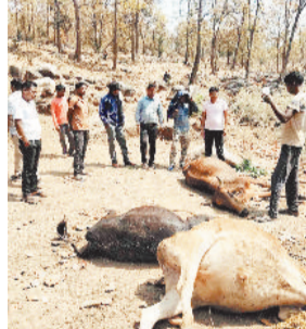
के बाद पिकअप में सवार सभी लोग मौके से फरार हो गए। वन विभाग एवं पुलिस की टीम ने मौके पर पहुंच कर मवेशियों को अपने कब्जे में लिया और मामले की जांच शुरू कर दी है। पुलिस ने पिकअप को डीपाडीह चौकी में खड़ी कर दी है। फिलहाल फरार आरोपियों की तलाश की जा रही है।

रात में गश्त कर रहे वन अमले की टीम को देख भाग रहा पिकअप चालक वाहन से नियंत्रण खो बैठा जिससे मवेशी से भरा पिकअप सड़क किनारे पलट गए। हालांकि किसी मवेशी की मौत नहीं हुई वहीं वाहन में सवार लोग मवेशी और पिकअप को मौके पर ही छोड़ फरार हो गए।